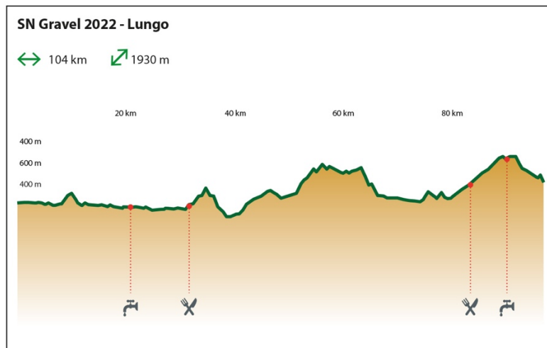
Figura 1: Infografica percorsi